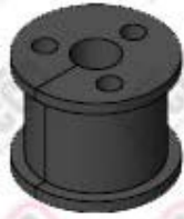
میدل سه تایی برای کابل RG 223